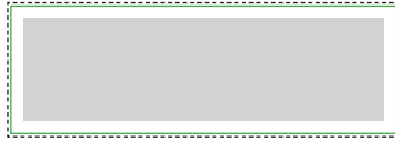
1:10 Vorlage auf Seite 2